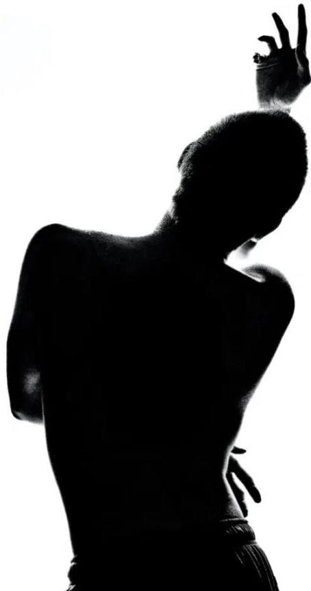
Figure 3. Poster image of a Screendance Laboratory from Wicklow (2022)

practice, it includes a multitude of subgenres, among which are the following: cinema, video art, visual art, dance. The resulting syncretism stimulates the creativity and potential of the artists by constantly inspiring them to get out of their comfort zone. Also known as dancefilm, cine-dance, dance for the camera or video dance, Screendance arouses a lot of enthusiasm among artists of any age, and, in my opinion, it must be integrated as a mandatory component of the education of today's dancers.