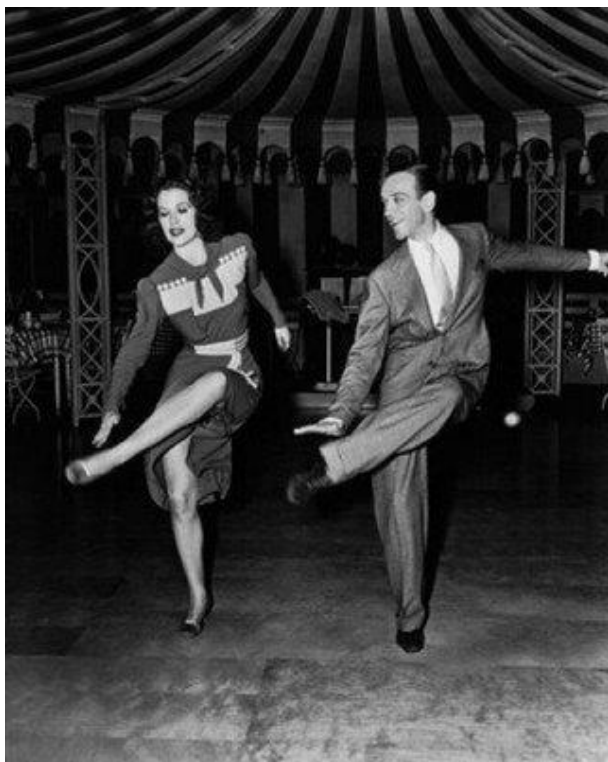
Figure 2. Eleanor Powell and Fred Astaire dancing in Broadway Melody of 1940

Postmodern times have simultaneously supported film, video & dance on the screen, and the phenomenon continues to evolve. Russia's Bolshoi Ballet, for instance, has developed its own digital project named Bolshoi in Cinema; UK's Northern Ballet has launched a digital Dance Programme, headed up by the extraordinary Kenneth Tindall, and Scottish Ballet has created Digital Season, emphasizing "reality, identity and transformation" ( https://www.scottishballet.co.uk/event/digital-season-19 ).